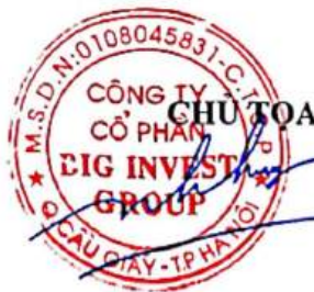
VÕ PHI NHẬT HUY